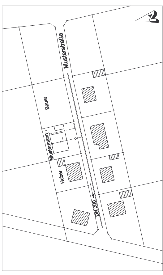
Lageplan M 1:1.000

Musterplan 2: Entwässerung eines Einfamilienwohnhauses ohne Keller im Mischsystem mit Oberflächenwasserversickerung